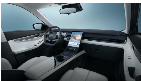
Světle šedý interiér 10 000 Kč