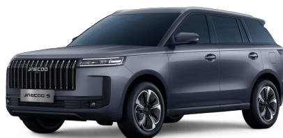
Zircon Gray 14 000 Kč