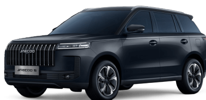
Canyon Black 14 000 Kč