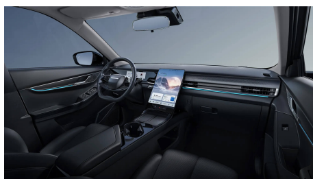
Černý interiér 0 Kč